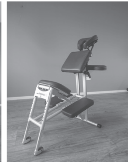
Collega's Talma kregen een lekkere stoelmassage ter plaatse.