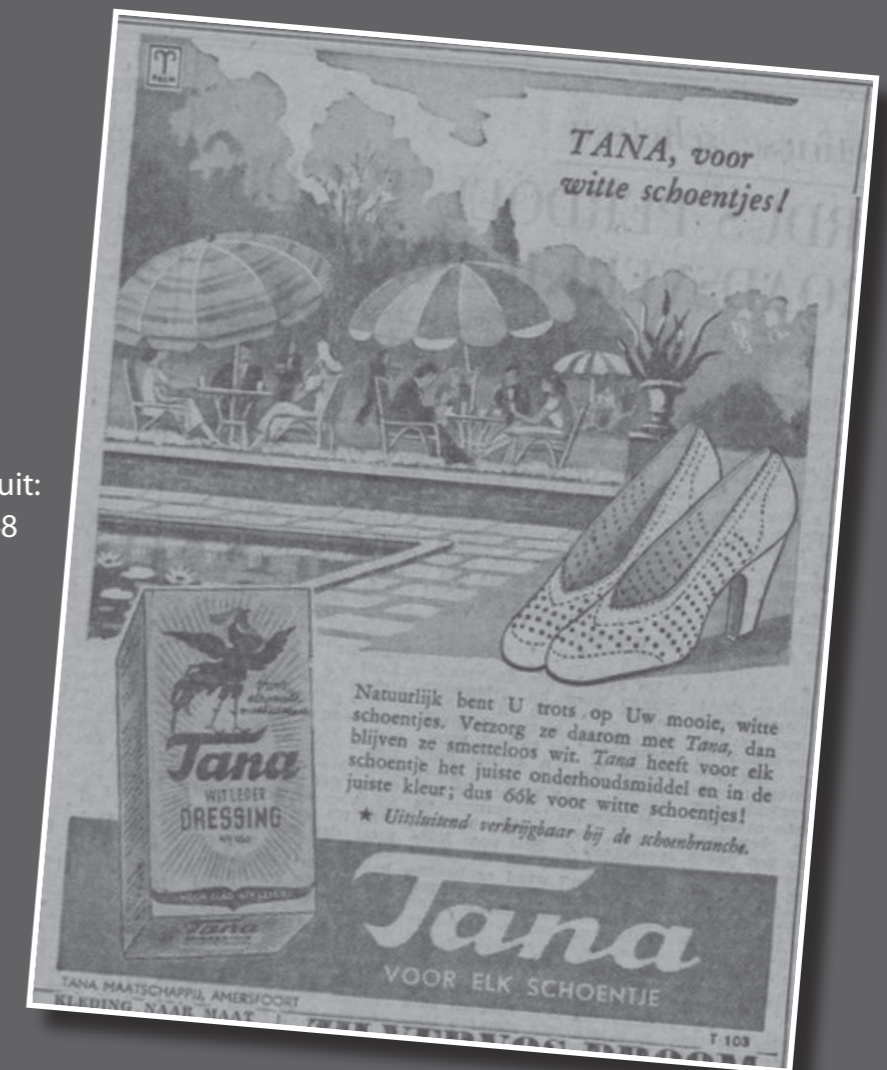
Reclame advertentie uit: Het Parool 18 juni 1848