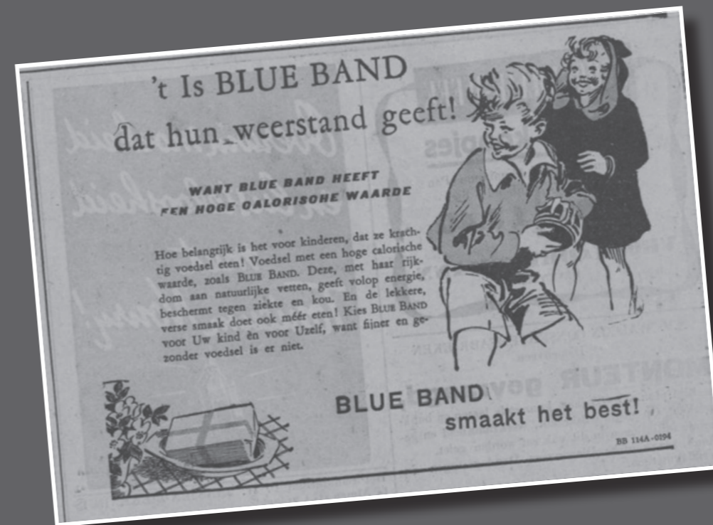
Blue Band reclame uit het Deventer Dagblad 3 maart 1949

Ziekenhuisstraat 14, 7141 AN Groenlo Tel: 06-13114417 (Karina Fremmer) / 06-22418579 (Monique Fokkert) Email: secr.clientenraden@szmk.nl