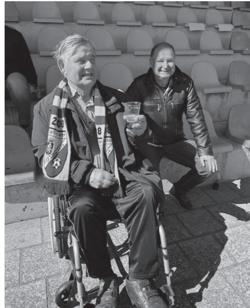
De uitslag van de wedstrijd was 3-1 in het voordeel van Lochem.