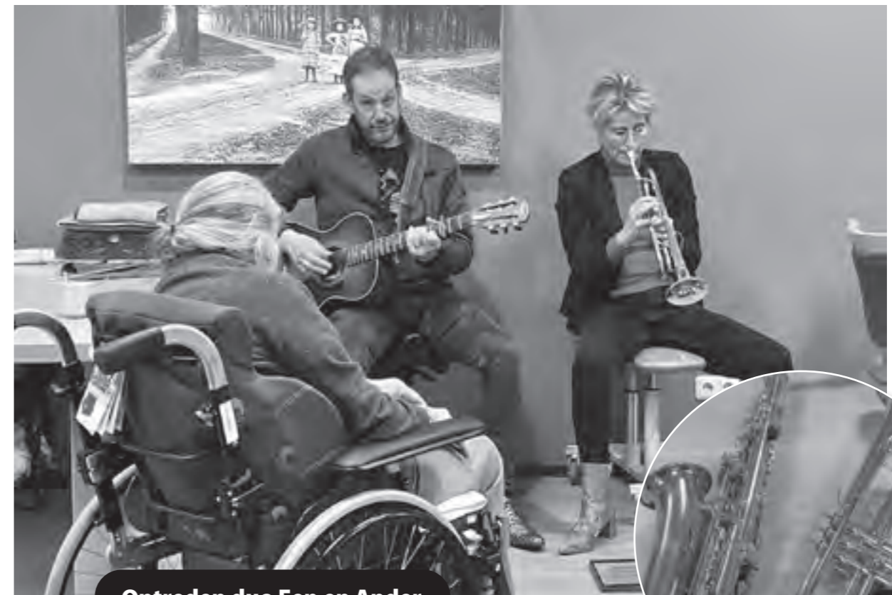
Optreden duo Een en Ander